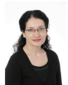
Judge Dace MITA